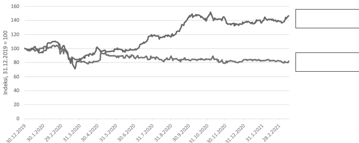
Viking linen ja Keskon osakkeiden hinta