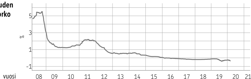
12 kuukauden euribor-korko

3. Korkotehtävä. Alla on esitetty euribor-koron kehitys 2008 - 2019. Tarkastele kuvaajaa ja vastaa alla oleviin kysymyksiin.