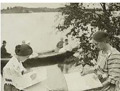
Baan äidin siskot taiteilemassa Laatokan rannalla Karjalassa.

He matkasivat ensin junalla Imatralle ja sieltä edelleen Turkuun. Vaarini isä oli määrätty sinne tekemään kallio- ja asevarastosuojia armeijan siviilityöhön, sillä rakennusmestareista oli pulaa.