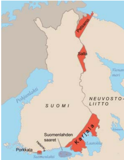
Suomen jatkosodan jälkeen Neuvostoliitolle luovuttamat alueet.

riemuissaan takaisin kotiseudulle ja aloitti tuhotun kotinsa uudelleenrakennuksen ja maanviljelyn. Asemasotavuosina Saksa kärsi raskaat tappiot, minkä seurauksena suomalaisten usko voittoon alkoi hiipua.