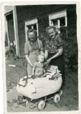
Nelly-sisko, Tyne-äiti ja vaari pienenä Pitkällä rannassa perheen palattua kotiinsa.

Sitten kun paluun aika koitti, odotti karjalaisilla paikanpäällä karu maisema. Vaikka kaikki oli raunioina, muuttointo oli kova ja monille oman talon raunioidenkin näkeminen oli elämän ihanin hetki. Pellot olivat täynnä pommisuoja, räjähtämättömiä pommeja oli joka puolella, tienvierillä ristejä ja metsissä kaatuneita. Maastosta löytyneet sotatarvikkeet kiinnostivat monia pikkupoikia eikä vahingoiltakaan aina välttytty. Uuteen elämään tartuttiin kuitenkin toiveikkaina: raunioita purettiin ja uusia asuntoja rakennettiin, kaivoja putsattiin, peruna kylvettiin ja metsistä kerättiin marjoja ja sieniä, joilla ensin tultiin toimeen. Miesten ollessa rintamalla apua saatiin vankileirien sotavangeilta, joita moni evakko yhä lämmöllä muistelee.