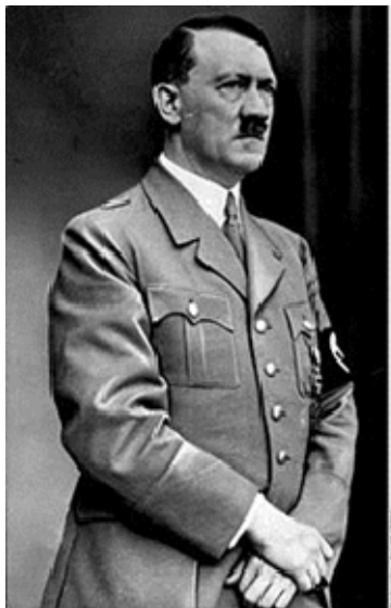
Saksan johtoon vuonna 1934 noussut Adolf Hitler sai Euroopassa aikaan suuria mullistuksia.

Vuosi 1939 muutti merkittävästä Euroopan voimasuhteista. Saksa oli hankkinut Hitlerin johdolla viimeisten vuosien ajan arjalaiselle ”herrakansalle” lisää elintilaa eli ”lebensraumia” yhdistämällä saksankielisiä alueita Kolmanteen valtakuntaan. Länsivaltojen noudattama myöntöväsyyspolitiikka loppui keväällä 1939, kun Hitler lupausistaan huolimatta miehitti Tšekkoslovakian. Sen jälkeen hän alkoi esittää vaatimuksia koskien ns. Puolan käytävää, joka jakoi Saksan valtion kahteen osaan. Sodan uhka alkoi olla ilmassa, kun Ranska ja Iso-Britannia ilmoittivat aloittavansa sodan Saksaa vastaan, jos se hyökkäisi Puolaan. Sitten tapahtui jotain odottamatonta: 23.8.1939 Saksa ja Neuvostoliitto ilmoittivat allekirjoittaneensa Moskovassa hyökkäämättömyyssopimuksen, jonka mukaan päävihollisina pidetyt valtiot lupasivat olla ryhtymättä