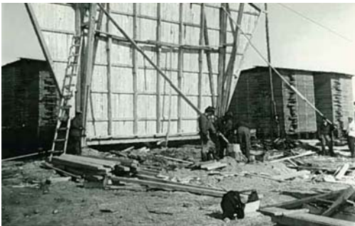
Ylhäällä kuva vaarin perheestä Martinniemes- sä. Kuvassa Maritta-sisko, vaari , äiti ja isä. Alhaalla kuva Martiniemen sahalta.

Vaarini muistaa paluumatkasta sen, että he menivät ensin Ylämyllyn kylään, joka sijaitsi Joensuun lähellä. Siellä he viipyivät pari viikkoa, kunnes muuttivat Pohjois-Pohjanmaalle Martinniemeen, sillä siellä oli saman yhtiön saha, missä vaarin isä oli töissä. Martinniemessä he asuivat vuoden 1953 loppuun, jolloin muuttivat Kelloon, kun vaarin isä siirtyi Oulun kaupungin palvelukseen. Vaari kertoo, että he kotiutuivat lopulta ihan hyvin. Hänen isänsä oli taas sahatyössä ja äiti perusti kampaamon. Heillä oli kuulemma kova Karjala-ikävä, mutta se, että samalle paikkakunnalle tuli muitakin karjalaisia, auttoi kotiutumaan paremmin. ”Viisi vuotta siinä kuitenkin meni, että pääsimme irti ikävästä ja isä olisi lähtenyt milloin vain takaisin ja odotti Karjalan