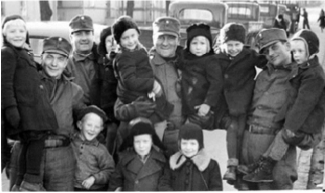
Evakot joutuivat asumaan aluksi toisten nurkissa selviytyäkseen talven yli.

Elokuussa 1944 valmistui ensimmäinen siirtoväen tulevaisuuteen viittaava laki, kun eduskunta sääti viljelysmaiden väliaikaisesta vuokrauksesta evakoille. Erityistä on se, ettei käsittelyn aikana viitattu sanallakaan siihen, että siirtoväestä tulisi pysyvää, vaan uskottiin vielä, että Karjalasta ei tarvitsisi luopua talvisodan rauhan rajoja myöten.