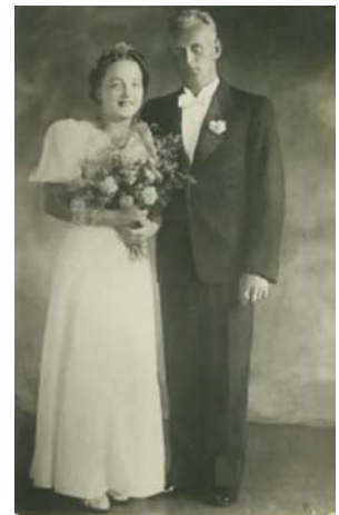
Vaarin vanhempien häähätkuva 20.8.1939.